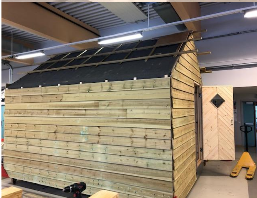
Døra står open – som eit symol på at den skal være open for alle som ferdast i fjellet .